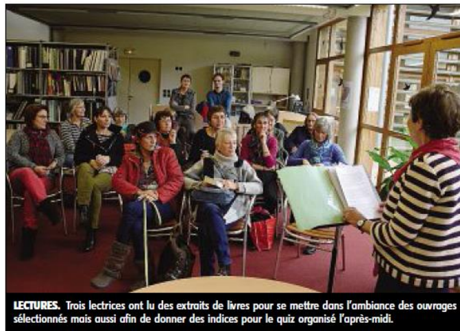
LECTURES. Trois lectrices ont lu des extraits de livres pour se mettre dans l'ambiance des ouvrages sélectionnés mais aussi afin de donner des indices pour le quiz organisé l'après-midi.

Depuis fin octobre, les lecteurs fréquentant les médiathèques ou bibliothèques du réseau partici-